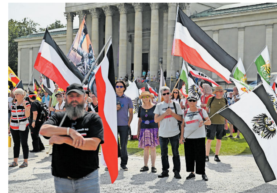
Kaiserreich-Flaggen beim Treffen der „25 + 1 Bundesstaaten“. Gemeint sind damit die 25 Gliedstaaten des Deutschen Reichs und Elsass-Lothringen.